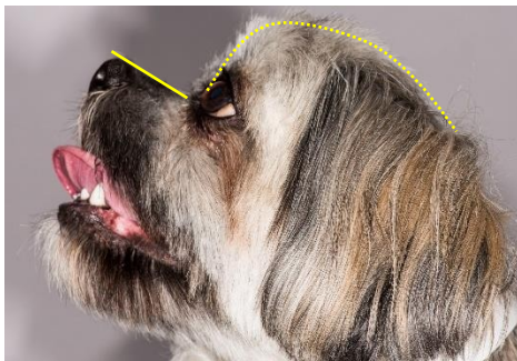
Figuur 3. Zichtbaar oogwit ten gevolge van een ondiepe oogkas bij de alerte, recht naar voren kijkende hond (kwadranten arceren)